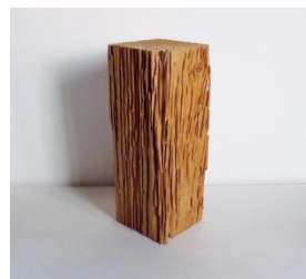
シロアリ被害構造材

また、近年の膨大な軒数の調査結果では、既存の対応策として一般に普及している<防蟻処理>では、かなり不十分だという事も判明してまいりました。